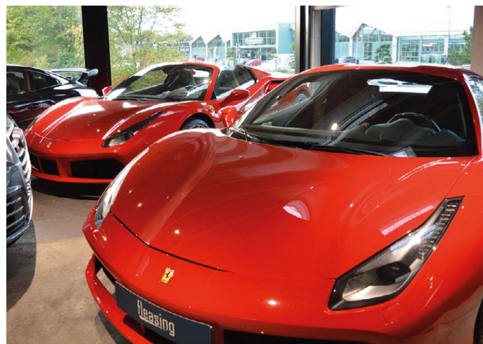
Fleasing har over 1.000 luksusbiler kørende på de danske landeveje. Disse to røde Ferrarier indgår i den samlede flåde.